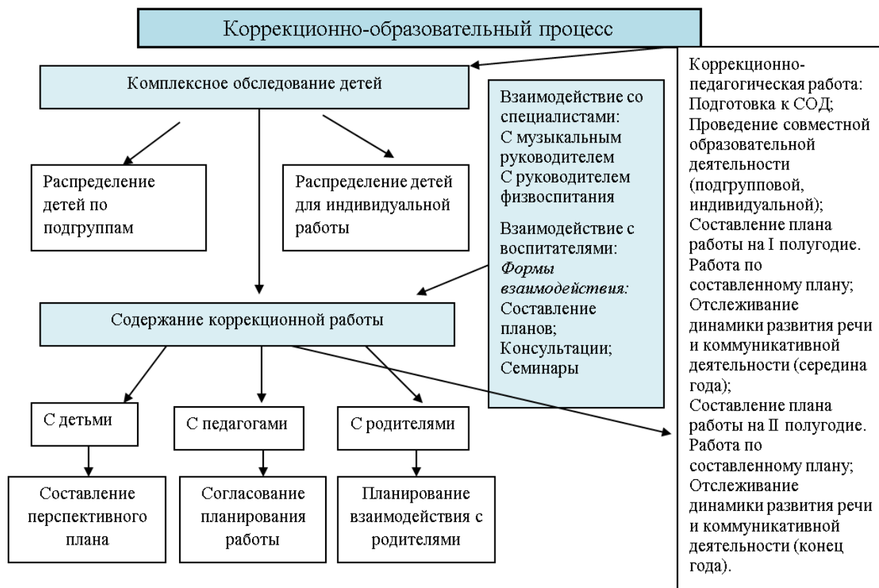
Схема организации коррекционной работы учителя- логопеда.